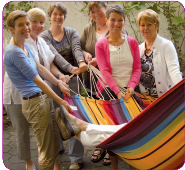
Unser Ambulantes Hospiz- und Palliative Care-Team

Palliative Versorgung bietet Patienten mit unheilbaren, weit fortgeschrittenen Krankheiten die Linderung von Beschwerden wie Schmerzen, Atemnot, Übelkeit und Erbrechen. Eine gezielte Lebensverkürzung durch Aktive Sterbehilfe oder Hilfe zum Suizid lehnen wir ebenso ab wie eine Lebensverlängerung um jeden Preis.