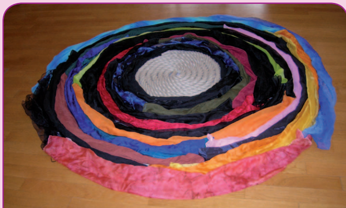
Die Spirale - Symbol für die Trauer

Neben dieser Fürsorge ist es uns wichtig, die Angehörigen in der Zeit der Trauer zu unterstützen und für sie da zu sein. Hierfür stehen ausgebildete TrauerbegleiterInnen zur Verfügung.